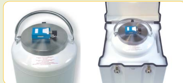
Voyageur Plus avec Thermory mobile