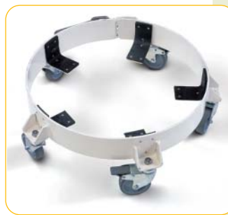
Embases à roulettes