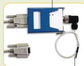
Sonde PT 100