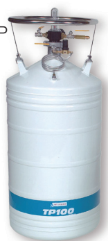
Alimentation d'azote liquide: TP récipient auto-préssurisé