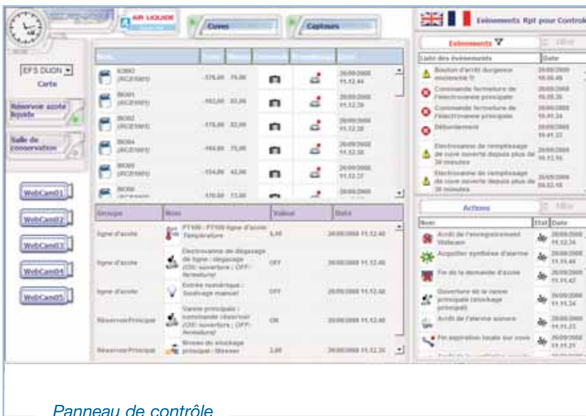
Panneau de contrôle

une solution complète et évolutive pour assurer la gestion optimale de votre salle de cryoconservation ainsi que la traçabilité des échantillons biologiques qui y sont rattachés