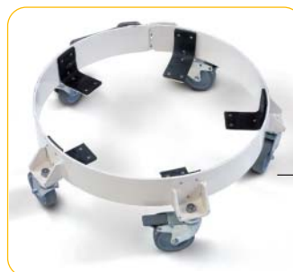
Embases à roulettes