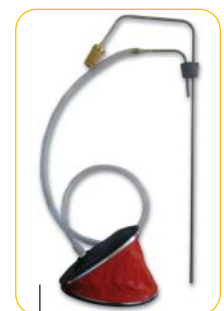
Système de soutirage